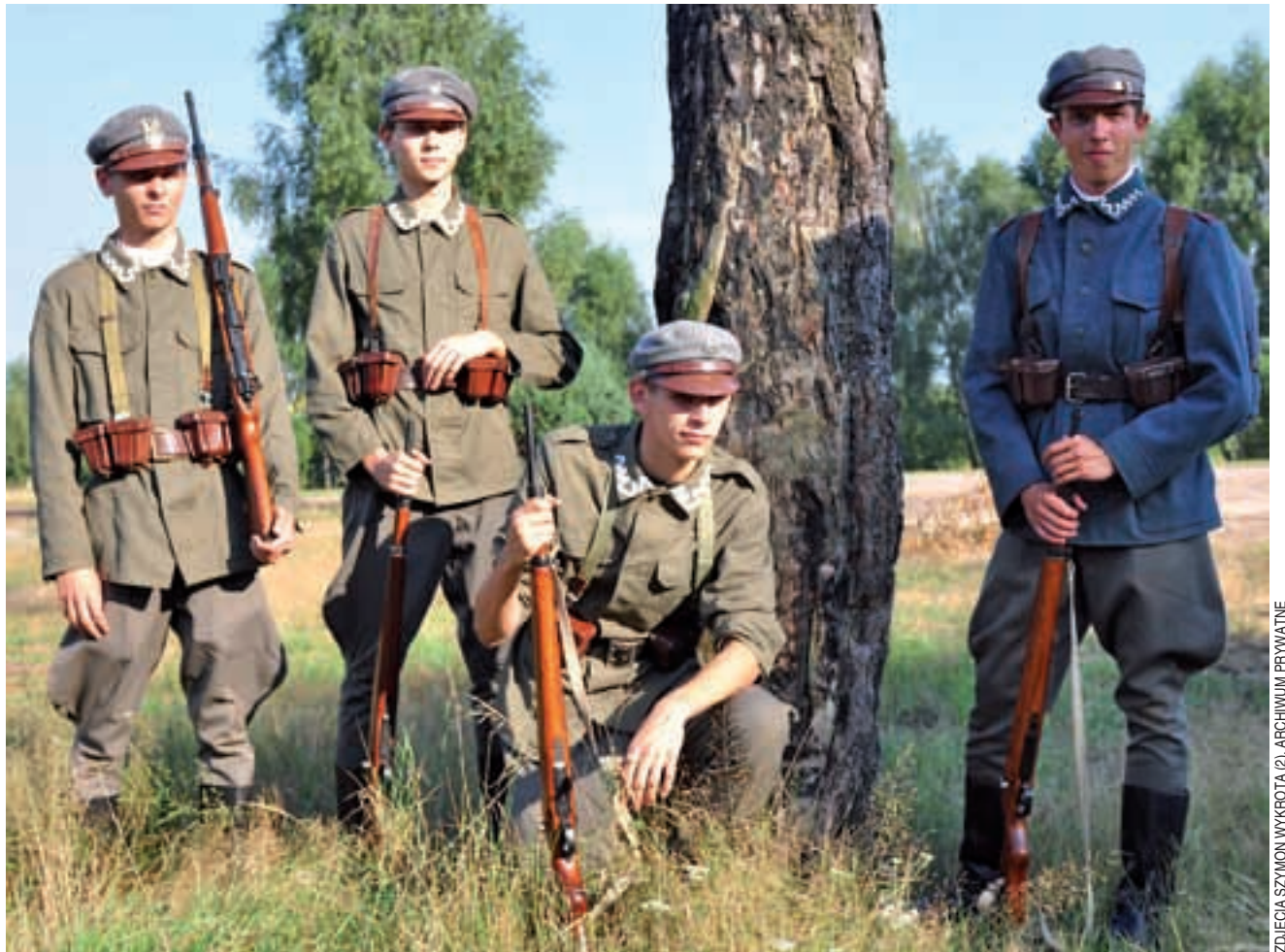
Młodzi strzelcy z radomskiego Związku Strzeleckiego też pojedą do Komarowa na plan zdjęciowy filmu „Bitwa warszawska 1920”.