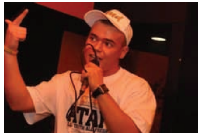
Absolut w radomskim podziemiu działa od 5 lat.