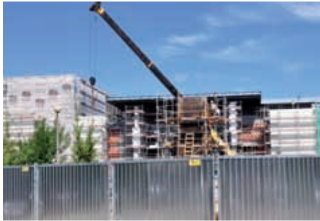
Za metalowym płotem na placu Jagiellońskim budowana jest kładka dla pieszych, która będzie prowadzić wprost do wznoszonej galerii.

Między do Kelles-Krauzą). Na odcinku między Miłą i Chrobrego są już ustawione krawężniki oraz przygotowana podbudowa jezdni. Po południowej stronie ulicy pojawiła się też pierwsza warstwa asfaltu.