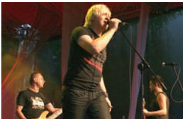
Dla gości Amfiteatru zagra w przyszły piątek radomska IRA.