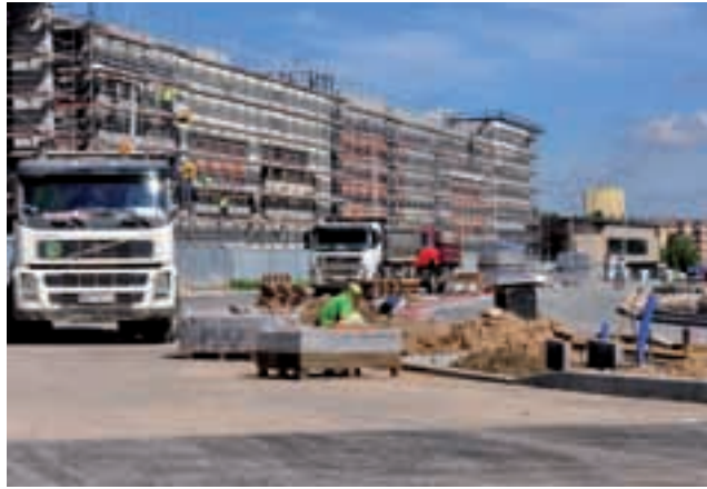
Budowa ulicy Chrobrego jest praktycznie na finiszu. Przy nowym skrzyżowaniu ze Struga powstaje sygnalizacja świetlna.

Największy front robót prowadzony jest na ulicy Struga (od ulicy