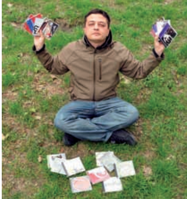
Iridium.shine jak zawsze zadbają o tłusty bas i o to, by licznik BPM się nie nudził.