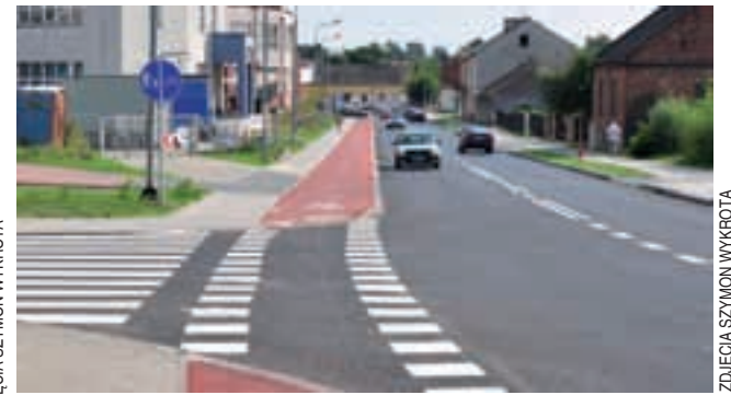
Wzdłuż przebudowanej jezdni i chodników powstała porządna droga rowerowa z czerwonego asfaltu.

W terminie zakończyła się przebudowa ulicy Głównej na Zamłyniu. W poniedziałek, jeszcze przed oficjalnym odbiorem, została otwarta dla ruchu. Z efektu prac cieszą się zarówno kierowcy, piesi i rowerzyści. W środę wróciły na Główną autobusy.