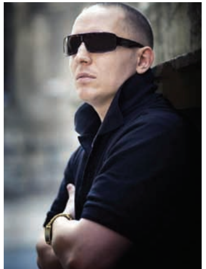
Jak brzmi Chada solo? To radomianie przekonają się o tym pierwsi.